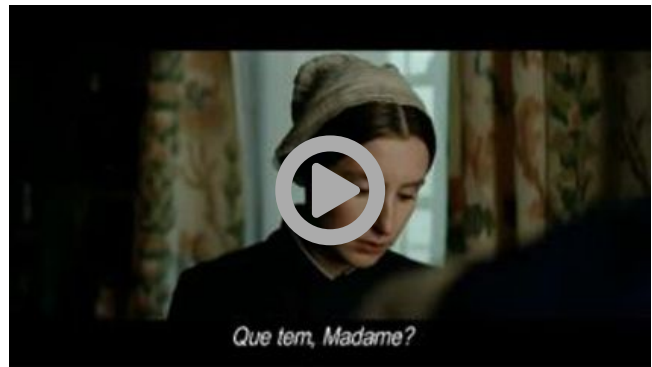
Tardes de Cinema - Madame Bovary