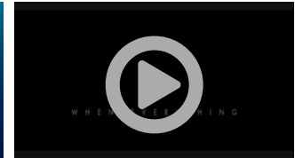
Tardes de Cinema - San Andreas